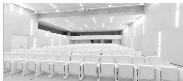
auditorium 220 places maximum

Les parents et l'ensemble des personnes concernées par le handicap (personnel de l'Education Nationale, médecins, rééducateurs et représentants des collectivités) seront accueillis à l'auditorium de h2o .