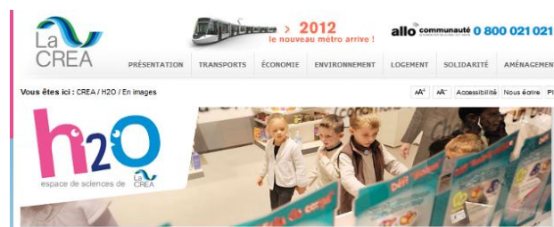
Patio de h2o et Hall d'exposition (Léonard De Vinci)

Des enfants du club de voile accompagneront les enfants dyspraxiques pour participer à des ateliers scientifiques (sur le vent, l'eau, etc...), ainsi que sur des animations artistiques (chant, dessin,...) Un petit déjeuner est prévu vers 10h15.